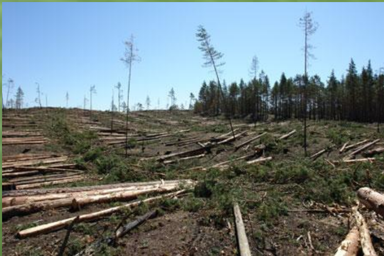
Знищення зелених насаджень