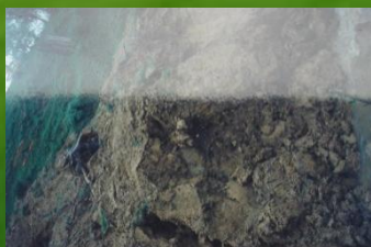
Зсуви внаслідок вирубки, с.Ільці, Верховинського району